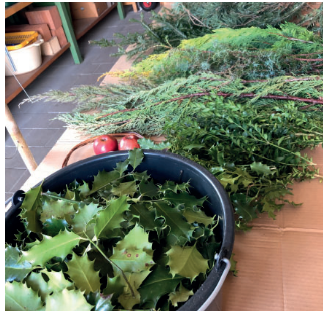
Alles parat zum Palmenbinden und Bürdeli machen.