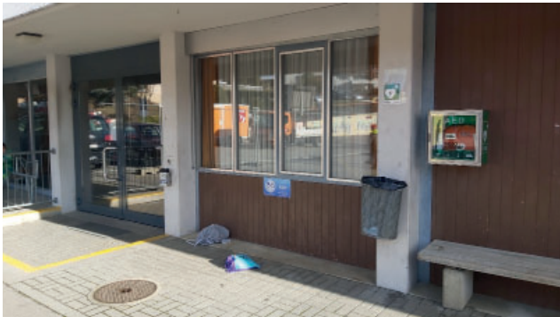
AED St. Erhard

den Grossprojekte in Knutwil und St. Erhard je einen AED (Automatischer Externer Defibrillator) anzuschaffen. Der AED bei der Fussballanlage Seebli konnte schon am definitiven Standort platziert werden. Der AED für die Mehrzweckhalle wurde vorerst provisorisch bei der bestehenden Turnhalle platziert. Beide AED sind rund um die Uhr frei zugänglich.