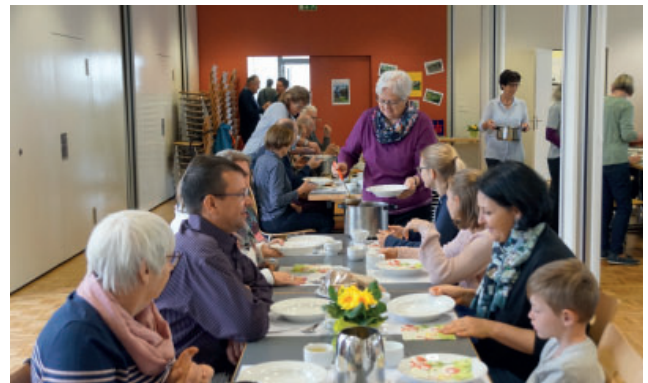
Nach zwei Jahren ohne Suppenmittag können wir nun endlich wieder gemeinsam essen - Suppenmittag 2019