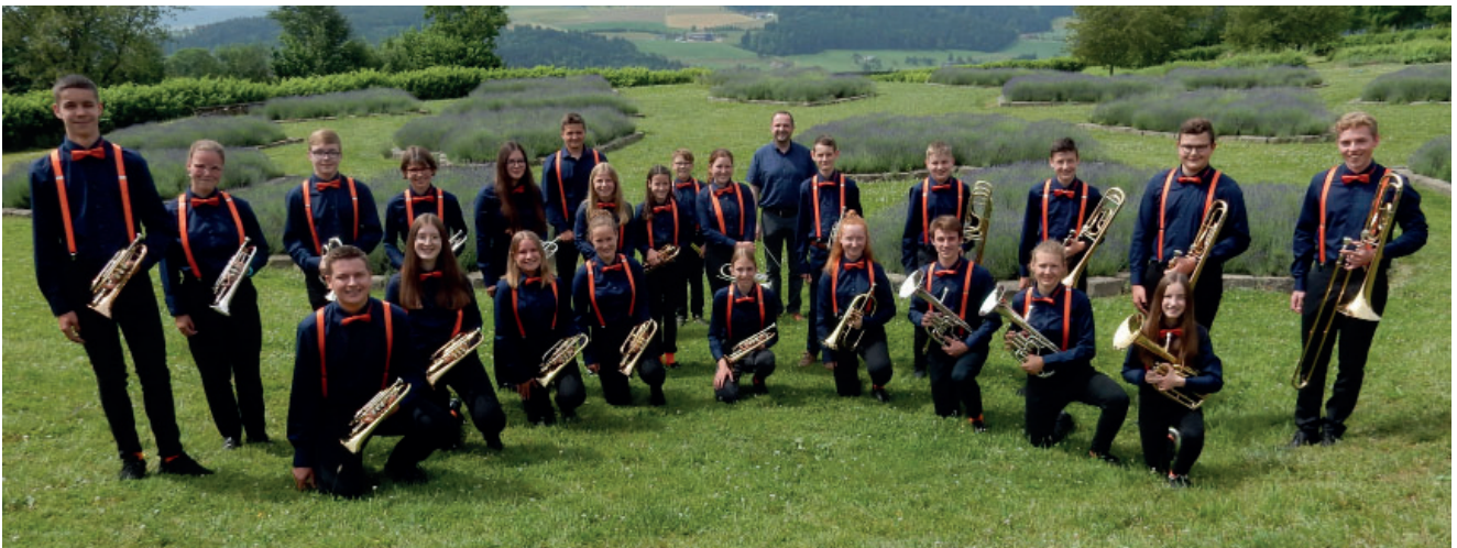
JBBH zu Gast am Frühlingskonzert der FMK

Am Samstag, 9. April 2022, konzertiert die Brass Band Feldmusik Knutwil in der Mehrzweckhalle Mauensee. Zu Gast ist die Jugend Brass Band Hürntal unter dem Motto «JBBH meets FMK». Wir garantieren ein Konzert mit viel Musik und jugendlicher Frische und freuen uns auf viele Zuhörerinnen und Zuhörer.