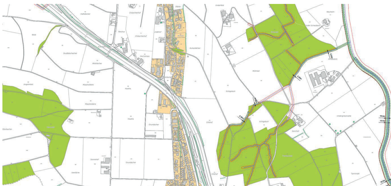
Ausschnitt Zonenplan Gewässerraum, Gemeinde Knutwil