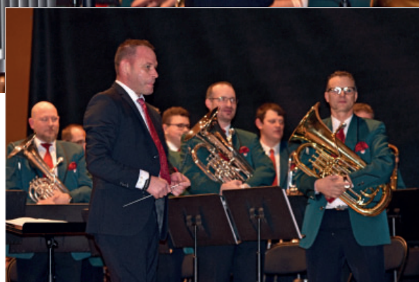
Vielen Dank für den Applaus